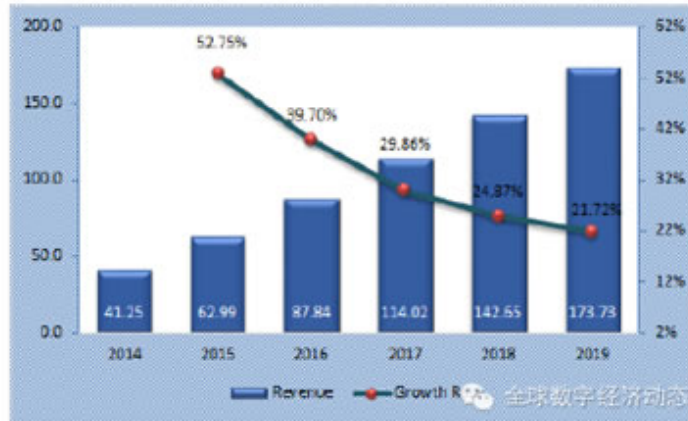
图 1 全球工业互联网服务市场（2014-2019）